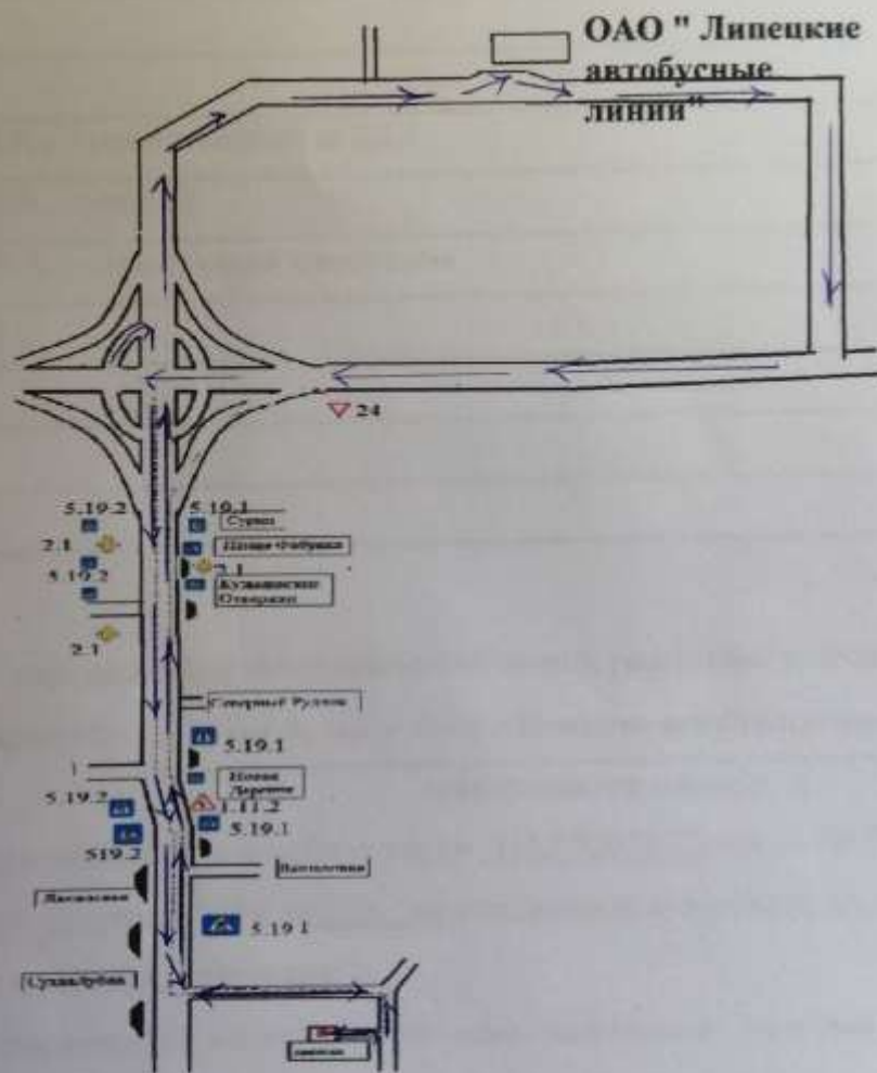
Схема движения школьного автобуса МБОУ СОШ с. Сухая Лубна имени Мозгунова А.З. гос. номером М292ВВ 48 по маршруту С. Сухая Лубна - ОАО " Липецкие автобусные линии" - с. Сухая Лубна г. Липецк, Универсальный проезд, 10а