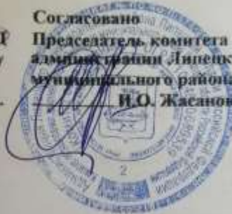
Схема движения школьного автобуса МОУ СОШ с. Сухая Лубя имени Молгунова А.З. гос номером М 292 ВВ 48 по маршруту с. Сухая Лубя - с. Боринское (бассейн "Волга") - с. Сухая Лубя